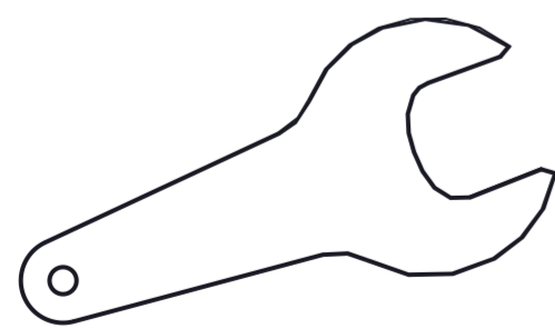
Chiave albero Shaft wrench